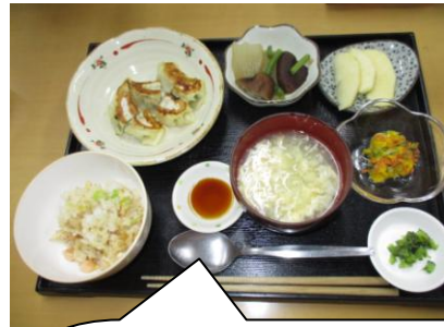
鮭とそぼろと卵の三色どんぶり パプリカとほうれん草のおひたし 千切りジャガイモと人参のソテー 里芋の柚子みそ煮