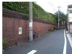
あらかわ荒川遊園地付近のレンガ塀