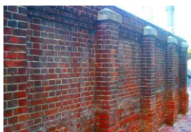
千住製絨所の面影