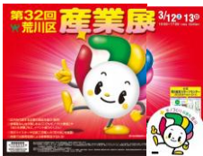
告知ポスター「わご丸」

区内を代表する優れた製品・技術を広く紹介。3月12日（土）と13日（日）10時～17時、