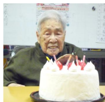
バースデーケーキ