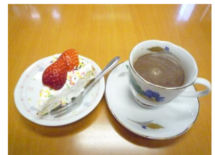
全員に用意されています