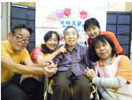
誕生日の記念撮影