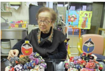
雄びなと雌びなを倒さないように、お手玉を取ります