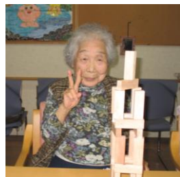
乗せて載せて、高くなった方が勝ち