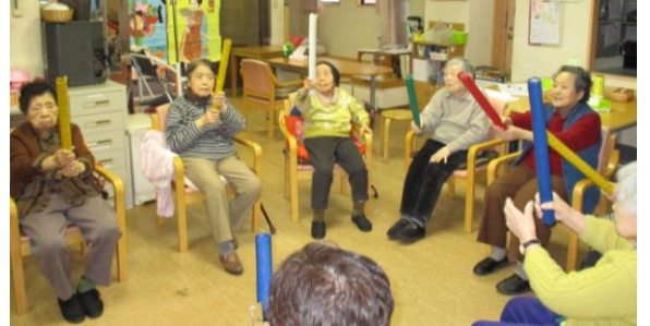
バトンを使って上肢を鍛える訓練体操