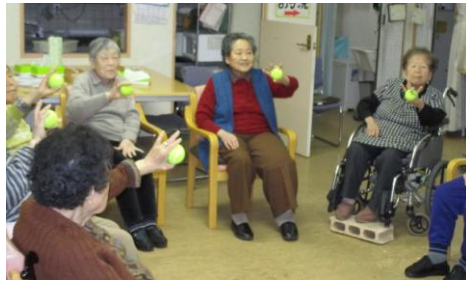
テニスボールで指と下肢の訓練体操