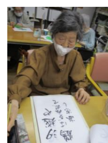
自信の出来栄え 書道練習