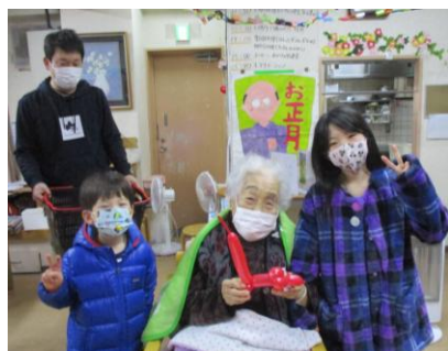
ご近所の小学生にバルーンプードルを頂きました