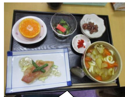
お蕎麦屋さんのカレーうどん 赤魚とアスパラの炒め物 モズクの酢の物、金時豆