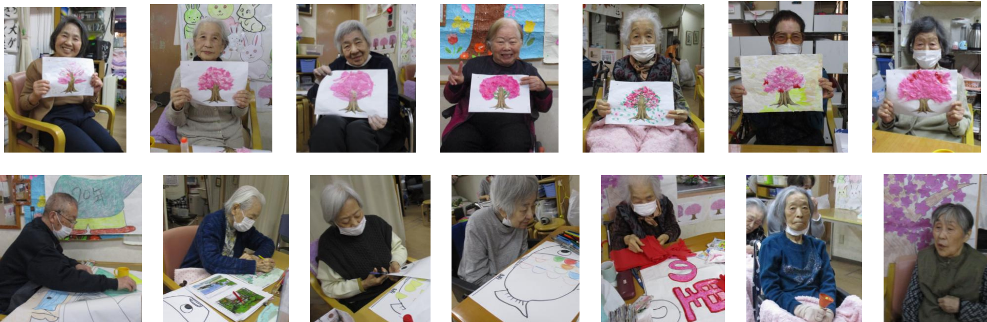
季節に因んだ貼り絵の作品を作りました