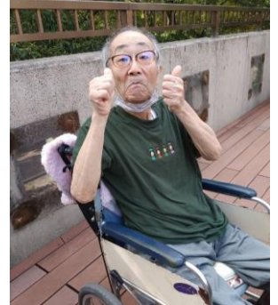
2階の休憩所で、お茶タイムを楽しみました