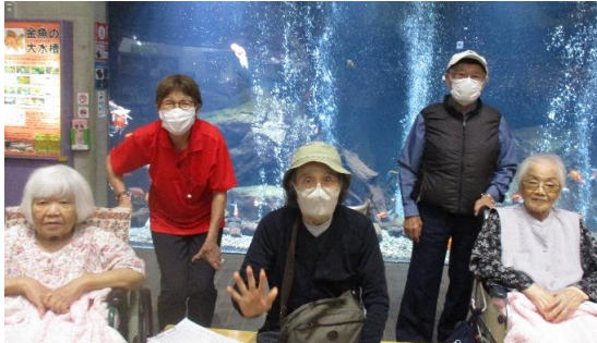
大きな水槽には、大小の珍しい金魚がたくさん