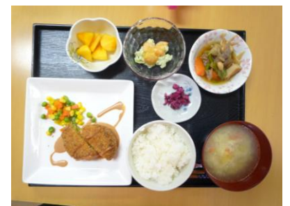
ツナとキャベツのメンチカツ エビとアボカドのサラダ、切り干し大根