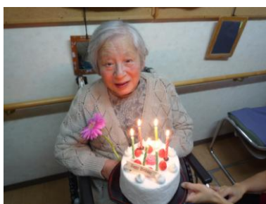
デコレーションケーキ