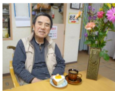
花とケーキでお祝い