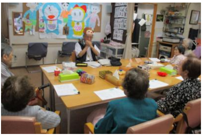
ハーモニカで懐かしい曲を合唱