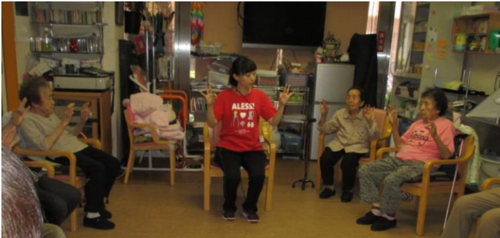
指先と脳のトレーニング