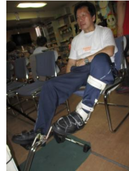
自転車こぎで下肢訓練