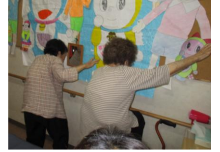
手すりを使った立ち上がり訓練