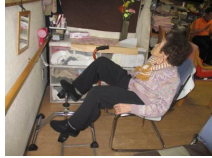
自転車こぎによる下肢訓練