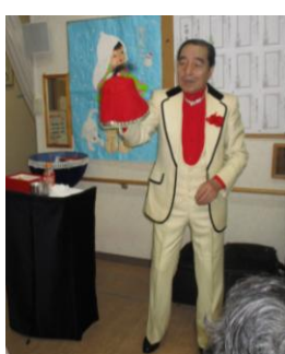
毎回素敵な衣装で 新しいマジックを披露