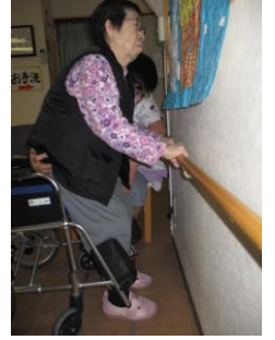
手すりでの立上り訓練