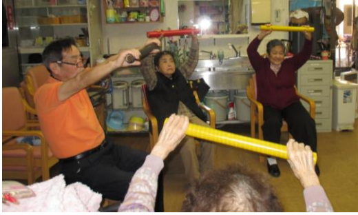
カラー棒を使った上肢下肢体操