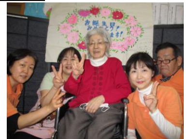
ダンディに変身Aさん 素敵な髪のSさん おしゃれなYさんとハイポーズ