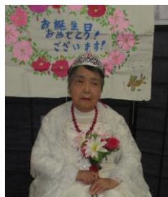
優しい笑顔のIさん チラシで作るゴミ袋はピカイチHさん 頑張り屋のOさん