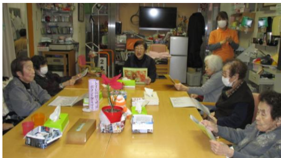
手作りの歌集で昔を思い出しながら おおきな声で歌いました