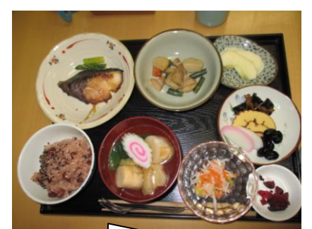
お赤飯 ぶりの照り焼き 正月雑煮、野菜の煮しめ 伊達巻、香の物、汁物。フルーツ