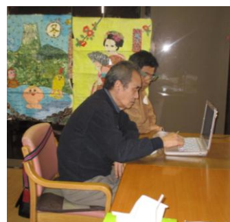
生活リハビリ訓練 興味のあるものを検索しています