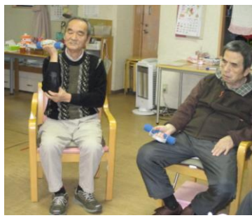
男性は1kgのダンベル体操