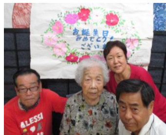
誕生日の恒例は、手作りケーキサービスと記念撮影