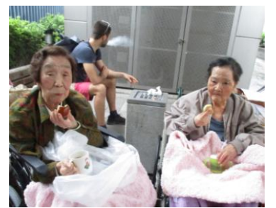
ボランティアさんによる楽しいレクリエーション